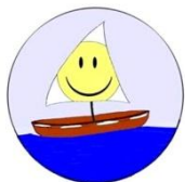
CDC des Sources Volet Pauvreté

Le volet pauvreté de la CDC des Sources a pour but d'améliorer les conditions de vie des personnes en situation de pauvreté et d'exclusion sociale vivant sur le territoire des Sources. Pour atteindre cet objectif, la Table d'action contre la pauvreté et l'exclusion sociale des Sources est un lieu d'échange, d'information, d'action et de soutien. Ensemble, les partenaires réfléchissent sur les causes de la pauvreté et de l'exclusion sociale, ils développent une vision concertée en partageant leurs connaissances et expertises, et ils agissent de façon concertée.